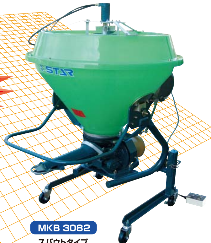
MKB 3082 スパウトタイプ