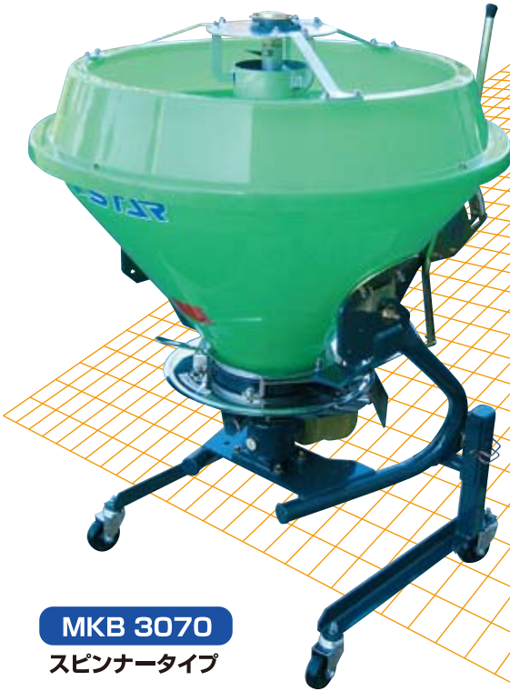
MKB 3070 スピナータイプ