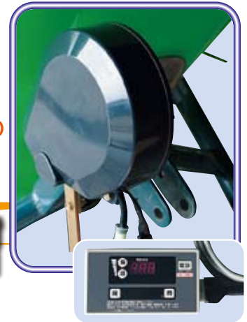
▲コントロールボックス